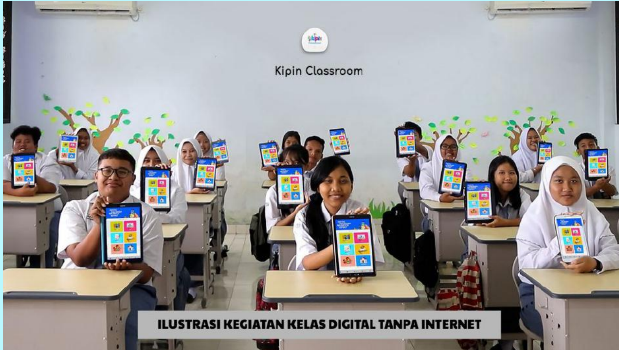
ILUSTRASI KEGIATAN KELAS DIGITAL TANPA INTERNET

Semua kota, di desa, di daerah 3T dan di lokasi manapun diseluruh Indonesia, setiap sekolah bisa menjalankan kegiatan pembelajaran secara digital dengan lancar berkat Kipin Classroom + Kipin School 4.0